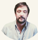
Por Oscar Soto

Polítologo y Magister en Estudios Latinoamericanos por la Facultad de Ciencias Políticas y Sociales-Universidad Nacional de Cuyo. Becario doctoral de CONICET. Integrante del CEFIC-Tierra (UST-MNCI-Somos Tierra). Docente e Investigador en movimientos sociales, teoría política y estudios latinoamericanos. Actualmente es co-editor de PACHA. Revista de Estudios Contemporáneos del Sur Global, (CICSH-AL