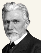
AUGUST BEBEL 1879

¿Qué es una mujer? ¿De dónde viene en la mujer esta sumisión? ¿Cómo ha empezado esta historia? ¿Por qué ganó el hombre desde el principio?