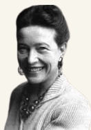
SIMONE DE BEAUVOIR 1949

¿Qué es una mujer? ¿De dónde viene en la mujer esta sumisión? ¿Cómo ha empezado esta historia? ¿Por qué ganó el hombre desde el principio?