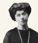
ALEJANDRA KOLLONTAI 1921

La mujer y el obrero tienen en común que ambos son oprimidos. Las formas de esta opresión han variado a lo largo de los tiempos y en los diferentes países, pero la opresión se mantuvo.