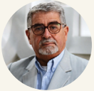
Por Roberto Escalante

Desde el Centro de Pensamiento Crítico Pedro Paz se viene reflexionando acerca de la universidad pública y el proceso de mercantilización que es sometida. En el Ciclo de Encuentros y Debates del año 2020, como en el Ciclo de Talleres "Pensando Críticamente la Especialización en Estudios Socioeconómicos